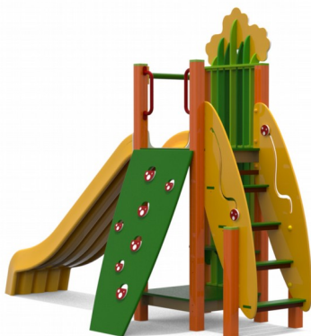
foto indicativa con il solo scopo di indicare la tipologia di prodotto