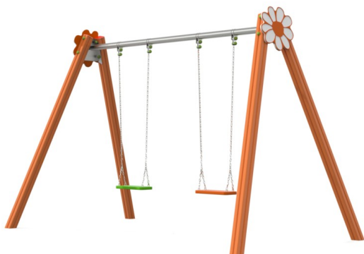
foto indicativa con il solo scopo di indicare la tipologia di prodotto