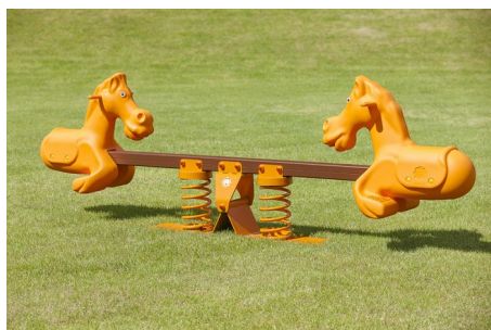
foto indicativa con il solo scopo di indicare la tipologia di prodotto