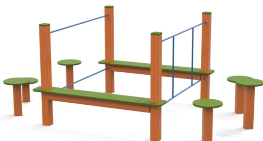
foto indicativa con il solo scopo di indicare la tipologia di prodotto